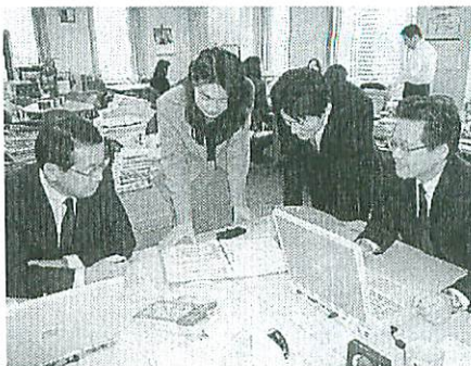
定年後も働き続けたいと考える中高年が増えている